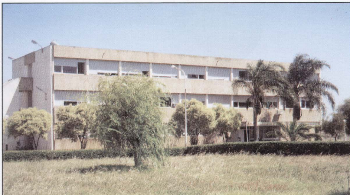
ITAF - Tessala - El-Merdja - BIRTOUTA - wilaya d'Alger