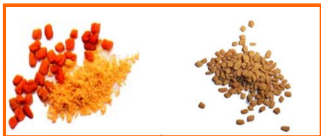
Les graines du fenugrec

hypoglycémiantes, hypolipidémiantes, antipyrétiques (contre les fièvres), etc.... Le fenugrec, grâce à la meilleure régulation des sécrétions pancréatiques qu'il permet, notamment celle de l'insuline, réduirait le cholestérol, limiterait la formation de caillots sanguins et régulerait le taux de glucose dans le sang. Le fenugrec est également un hépatoprotecteur et, grâce à ses propriétés anti-oxydantes, un anti-cancérigène (Cancers du colon, du sein et de la vésicule biliaire). En Algérie, le fenugrec, utilisé pour aromatiser les sauces, éteindre la soif ou nourrir le bétail qui l'apprécie beaucoup, est cultivé dans la région du Touat et du Gourara (Adrar) à une échelle très modeste à des fins essentiellement d'auto- consommation. Son rendement serait d'environ 2kgs par « guemmoune » de 20 m 2 ou de 20 à 25 quintaux par hectare. Selon certaines études publiées par l'Institut National de la Recherche Agronomique d'Algérie, en 2004, les possibilités de développement de la production du fenugrec, au Nord comme au Sud du pays, ne seraient pas négligeables, après des campagnes de vulgarisation adéquates et la mise en place de circuits de commercialisation adaptés.