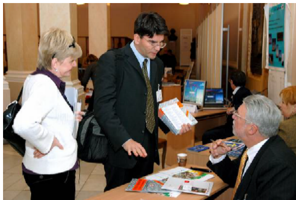
Exemple d'espace-rencontres, lors du forum franco-ukrainien de l'Energie à Kiev – octobre 2006 (*)

Nb : Les opérateurs seront invités par la ME, pour rencontrer les participants français (diffusion de votre company profile en amont)