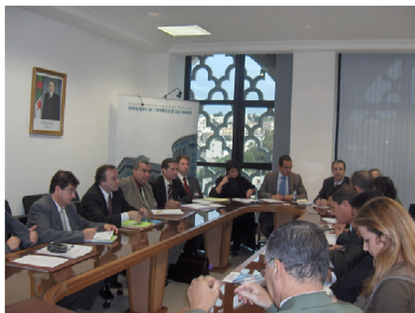
Exemple de rendez-vous collectif, lors de la mission découverte « Energies renouvelables » à Alger – décembre 2006 (*)

Les rendez-vous collectifs conduiront la délégation française au sein de Ministères, compagnies, agences nationales et centres de recherche indiens : d'une durée d'1h \frac{1}{2} à 2h, chaque rendez-vous permet, après l'intervention des hôtes indiens, une présentation en quelques minutes de chaque société française afin de poursuivre les débats (activités, références, ambitions sur le marché indien...)