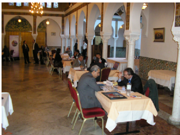
Exemple d'espace-rencontres, lors de la mission découverte « Energies renouvelables » à Alger – décembre 2006 (*)