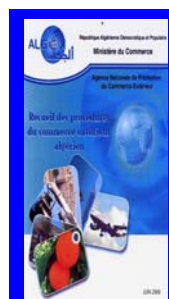
RECUEIL DES PROCÉDURES DU COMMERCE EXTERIEUR ALGERIEN 2008