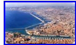
Le Port de Marseille

Le Consortium est créé sous la forme d'une Société anonyme, composé d'un Conseil d'administration et d'un Directeur Général.